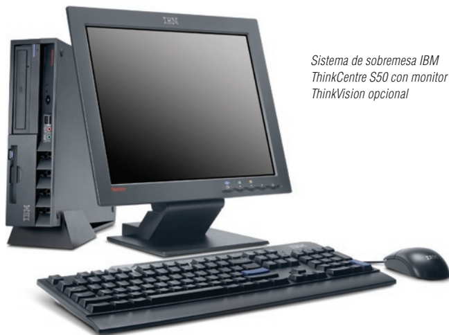
Sistema de sobremesa IBM ThinkCentre S50 con monitor IBM ThinkVision opcional

IBM recomienda Microsoft® Windows® XP Professional for Business.